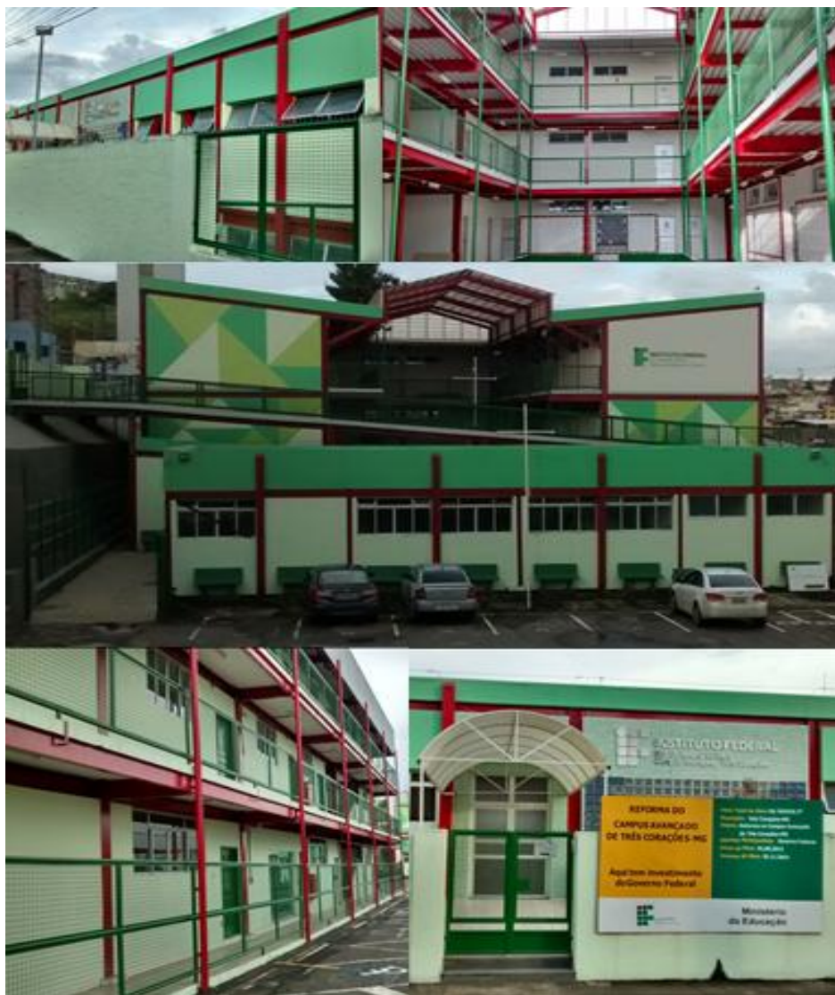
Figura 4 - Blocos pedagógicos e administrativos

No ano de 2015, após a aprovação da Lei Orçamentária Anual, serão efetivadas ampliações na infraestrutura do Campus Três Corações. Entre elas, destacam-se: