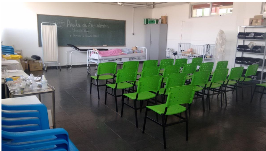
Figura 5- Laboratório de Enfermagem