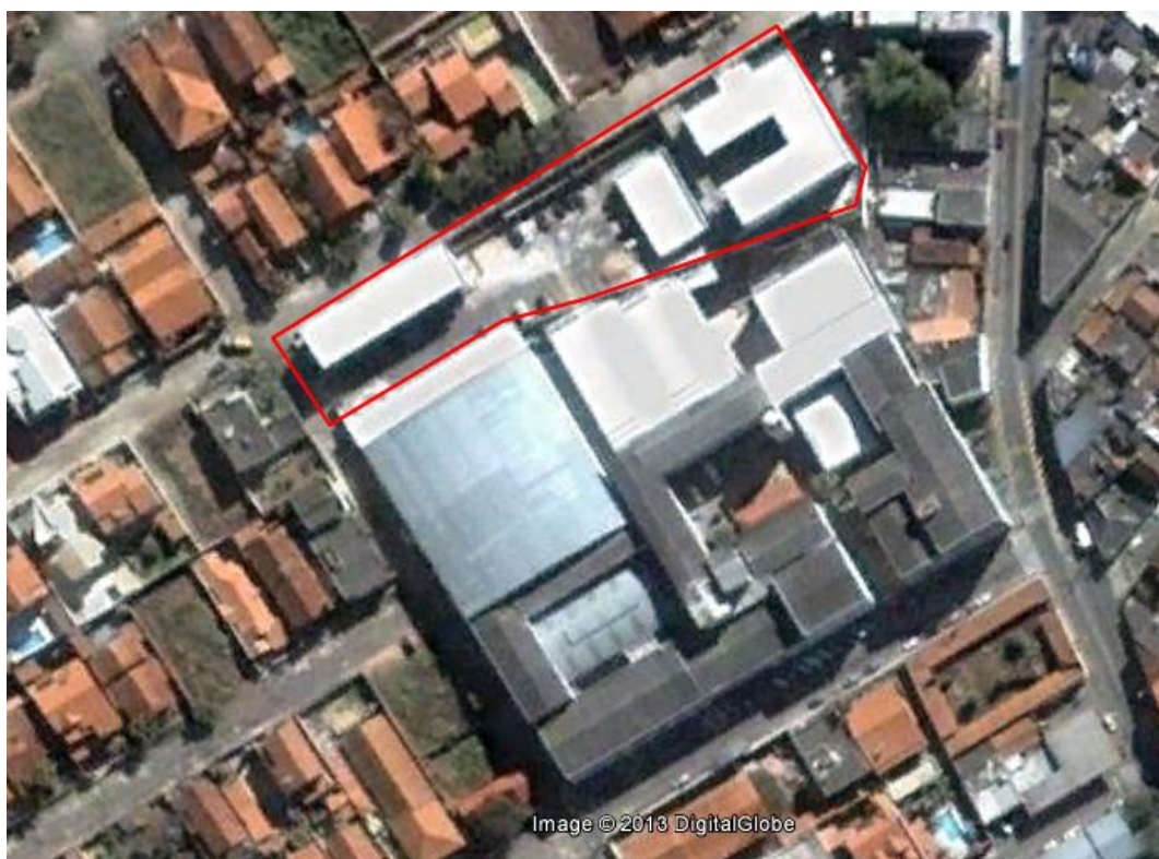
Figura 3 - Vista aérea das instalações do Campus Avançado Três Corações

O Campus Avançado Três Corações ocupa um terreno de 4.112,50 m 2 , com uma área construída de 2.866,92 m 2 com cobertura. São 18 salas de aula, 1 laboratório de mecânica em fase de implantação, 3 laboratórios de informática em funcionamento, 1 laboratório de informática em fase de implantação e 1 (um) laboratório de enfermagem. A seguir são apresentadas à vista aérea das instalações do Campus Avançado Três Corações (Figura 3), a imagem dos blocos pedagógicos e administrativos (Figura 4) e informações sobre a infraestrutura do Campus.