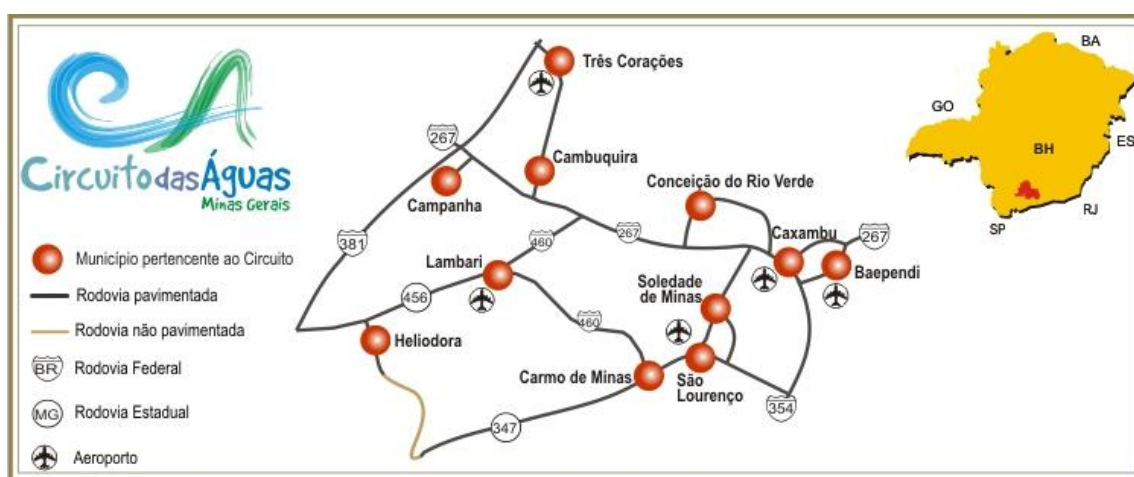
Figura 2 - Municípios pertencentes à região do Circuito das Águas

Na Figura 2 são representados os municípios pertencentes à região do Circuito das Águas, assim como as localizações geográficas das mesmas.